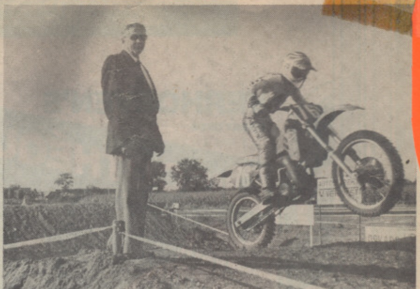
Voorzitter Arts op het circuit Industrieterrein tijdens de eerste 875 cc cross van Nederland.

De wedstrijd van 12 juni 1966 was om nooit te vergeten. Wereldkampioen schaatsen Kees Verkerk kwam, om de prijzen uit te reiken. Ook het Polygoonfilmjournaal is toen opnamen komen